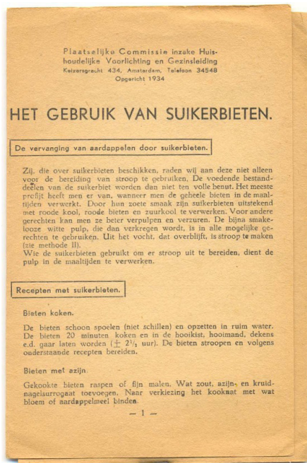
Suikerbietenrecept. Collectie Verzetsmuseum, Amsterdam

Onder normale omstandigheden zijn suikerbieten veevoer of ze worden gebruikt om suiker van te maken. Tijdens de hongerwinter werden ze door mensen gegeten. Suikerbieten zijn nog wel te eten omdat ze zoetig zijn. Er worden allerlei recepten voor bedacht. Omdat suikerbieten vaak keihard zijn worden speciale raspers gemaakt.